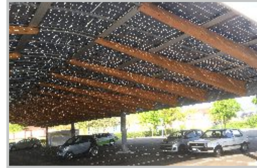
3| PV-Anlage Parkplatz Rheinfeldern