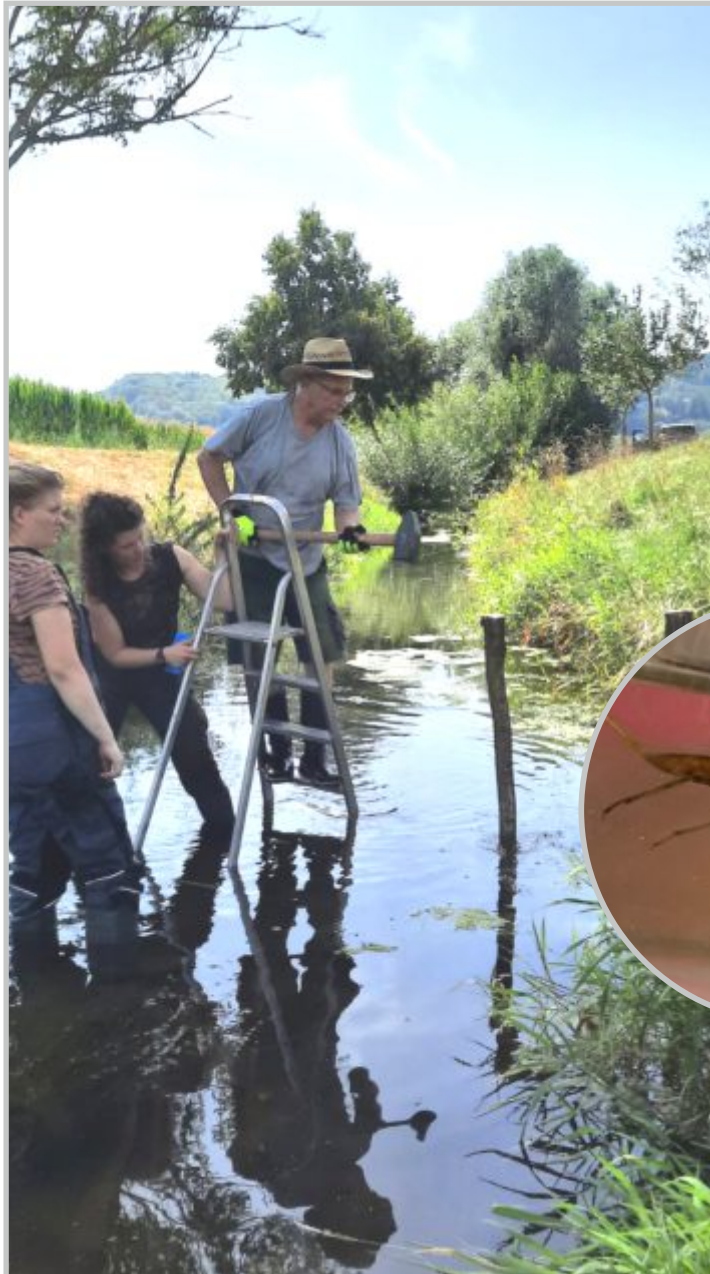
38 | Bühnen und Ufergestaltung