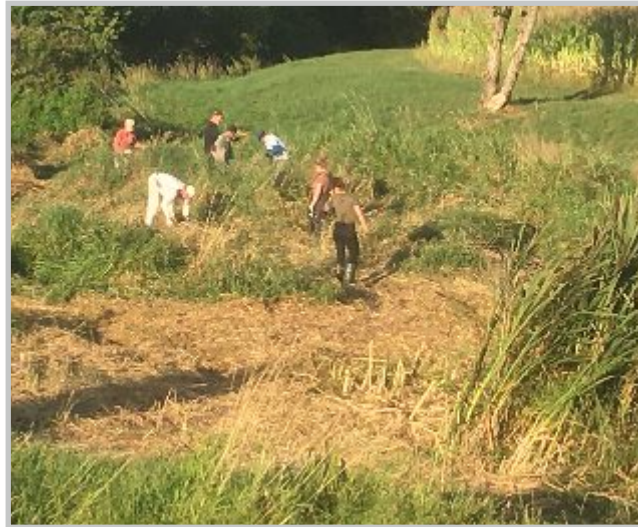
39 | Springkrauträumen Klingengraben