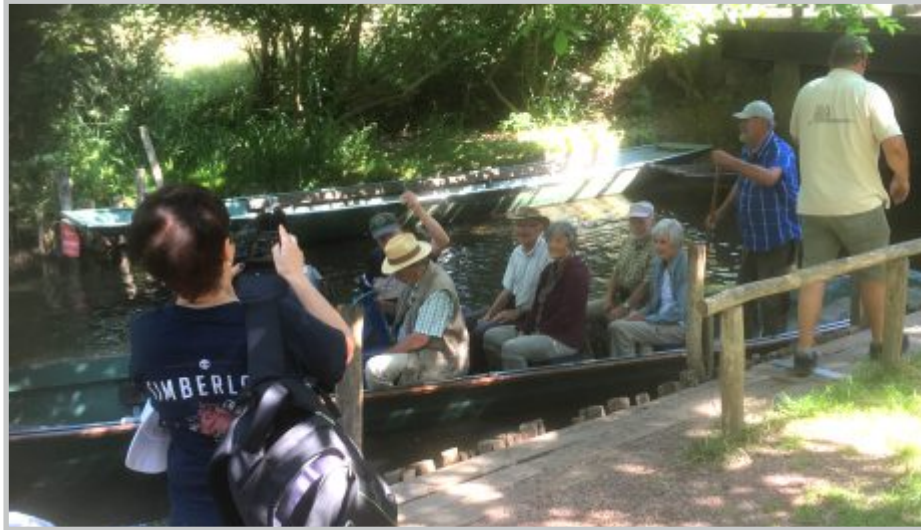
20 | Taubergjessen