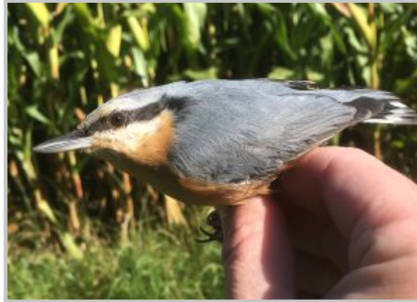
36 | Kleiber