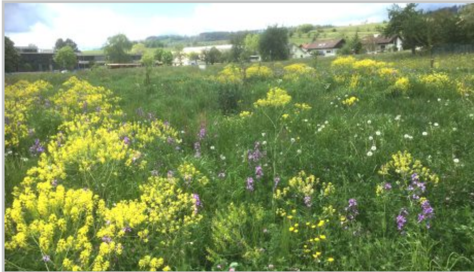
16| Streuobst-Blühwiese Realschule Klettgau