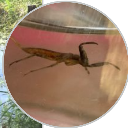
40 | Wasserskorpion