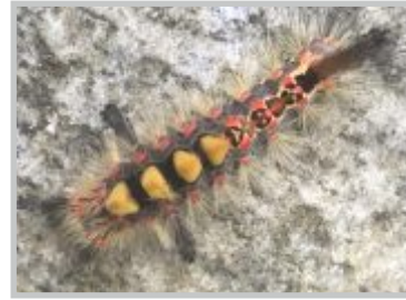
17| Schlehen- Bürstenspinner