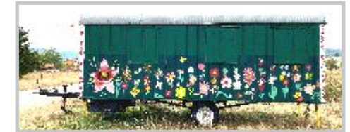
32| Bauwagen mit neuem Anstrich