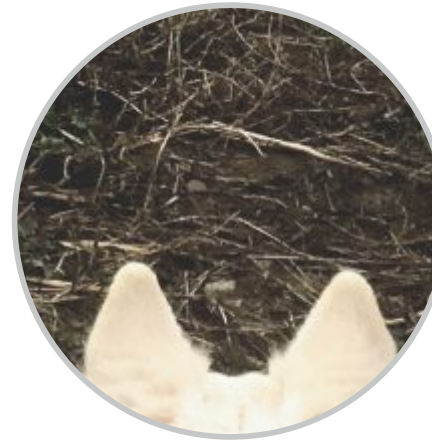
5 | Rätsel: Was ist denn das? Man sieht es am unteren Rand von Bild 7. Auflösung letzte Seite.