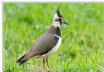
48| Kiebitz, Vogel des Jahres