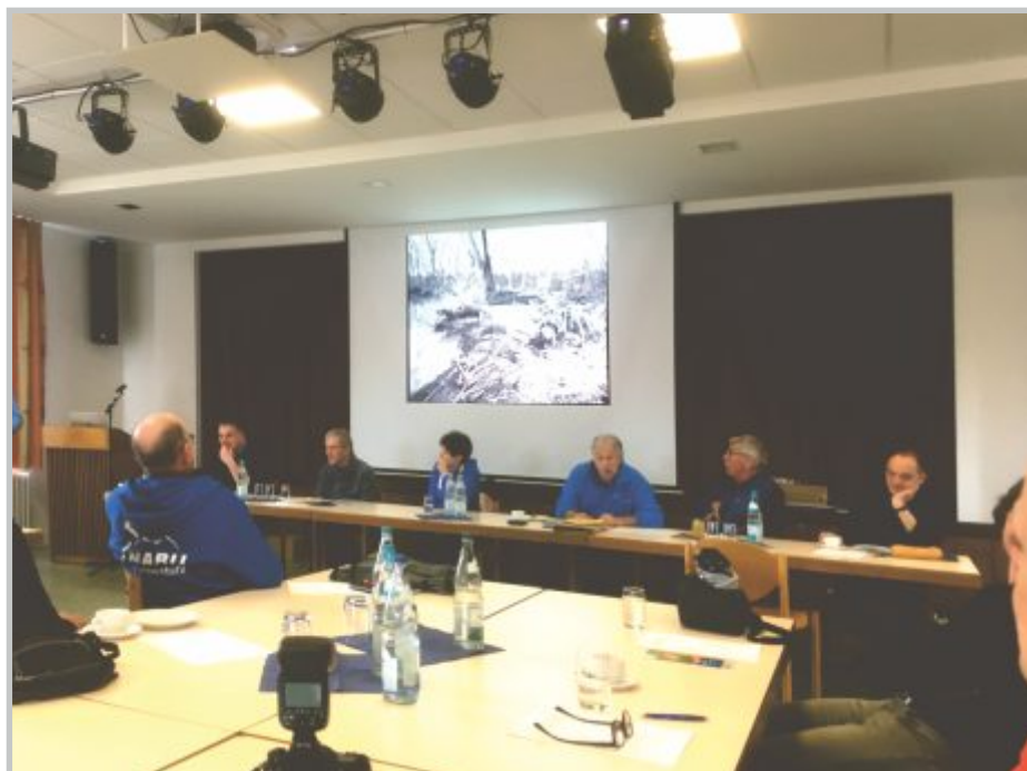
8 | Regionalverbandstreffen NABU Freiburg