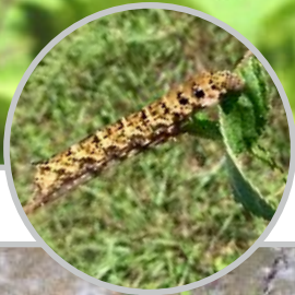
27| Mittlerer Weinschwärmer