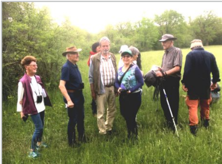
19| Botanikexkursion, Orchideen, Magerrasen