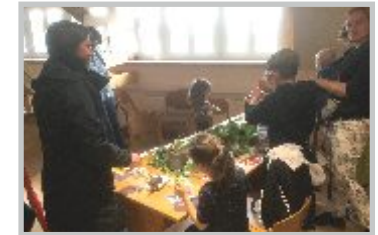
18| Tag d. offenen Tür, Kornhauseröffnung