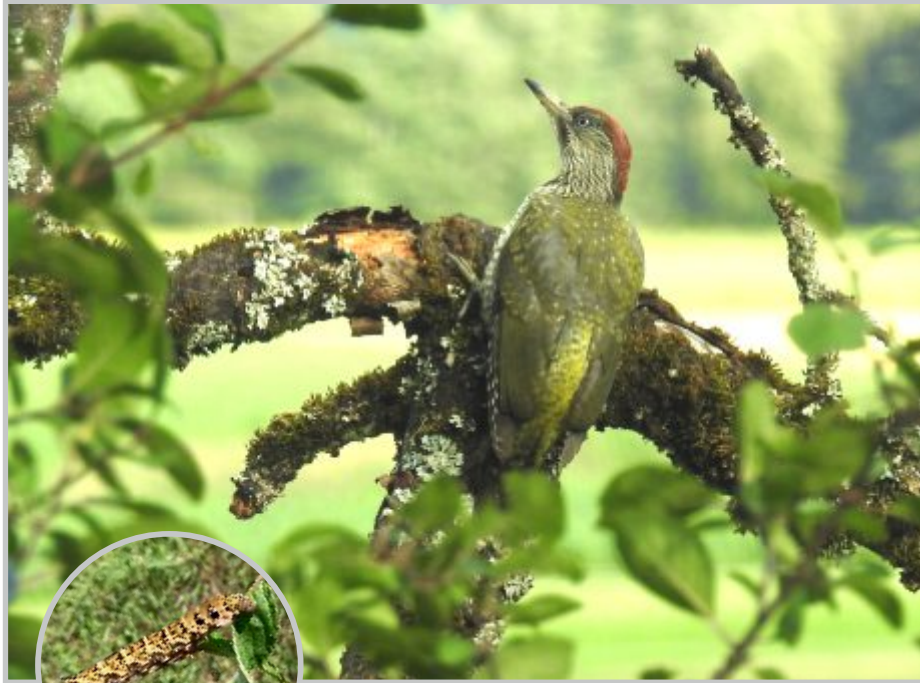
24| Junger Grünspecht im gepunkteten Jugendkleid