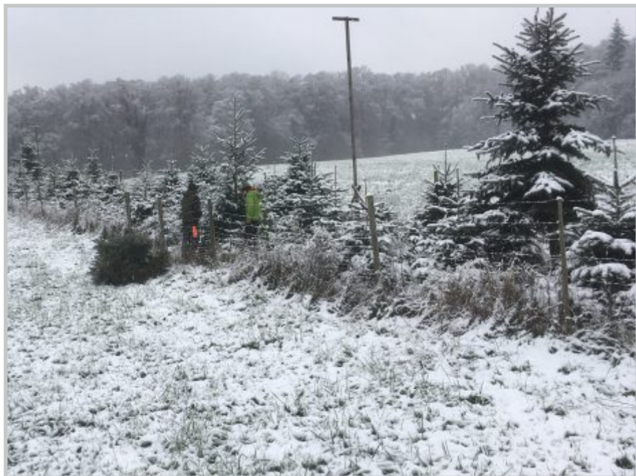
45 | Dompfaff