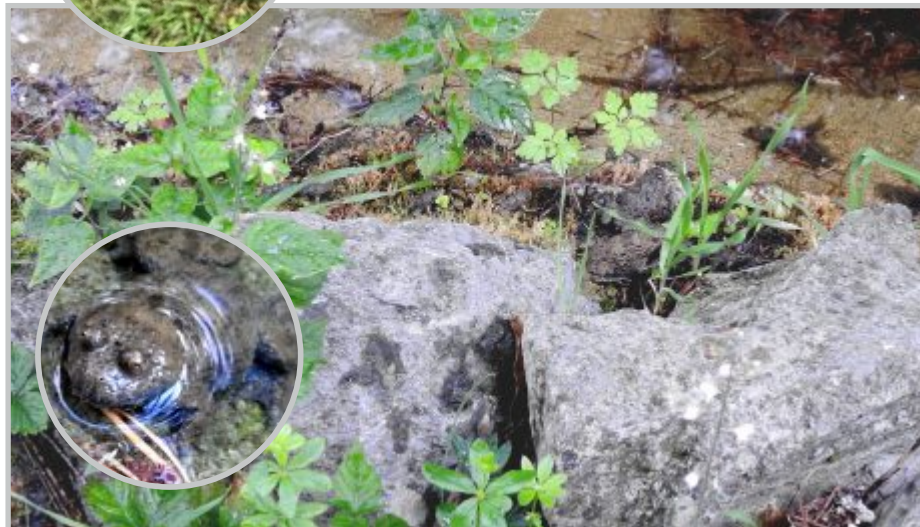
28 rundl Gelbbauchunke