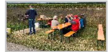
37 | Einweihung Trockenmauer Lauchringen