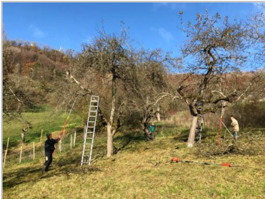
43 | Baumschnitt Küßsberg