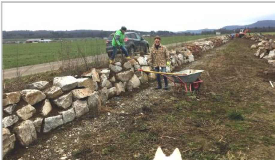
7 | Trockenmauer Humus verteilen