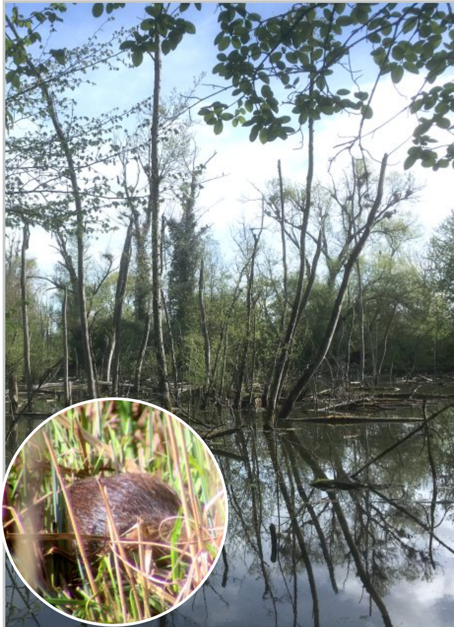
13| Nutria auf Binsen