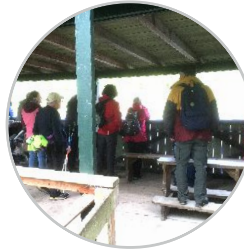
14| Kleine Camarque Beobachtungshide