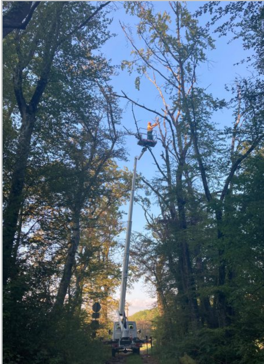
35 | Baumsicherung Birdwatch Wannenberg