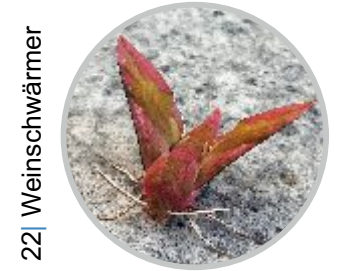
22 | Weinschwärmer