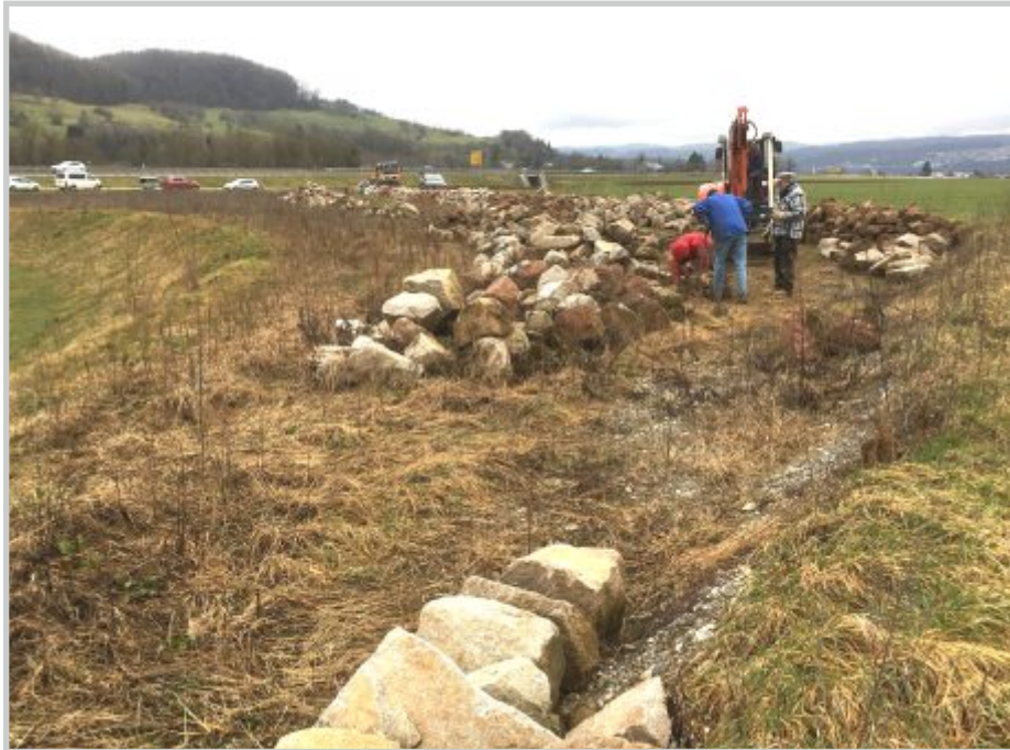
4 | Trockenmauer Lauchringen Steine setzen