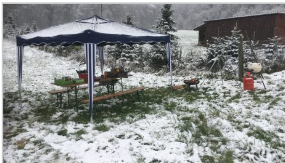
44+47 | Weihnachtsbaumschnitt/Abgabe