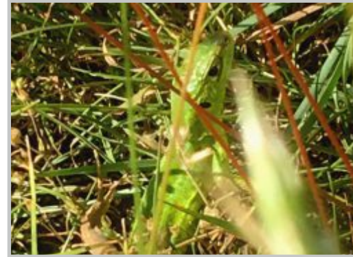
21 | Smaragdeidechse