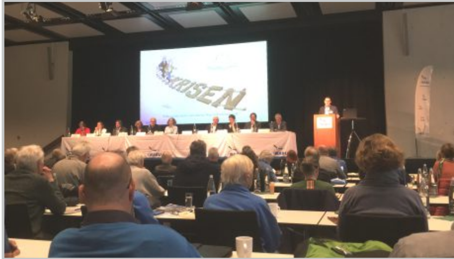
41 | NABU LVV Landesvertreterversammlung in Stuttgart