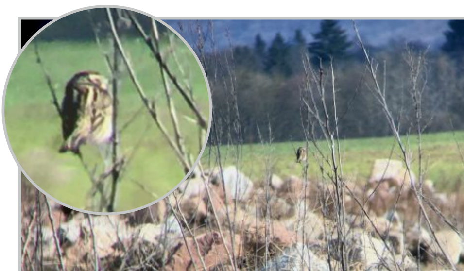
10+11 | Erlenzeisig in Trockenmauerbiotop