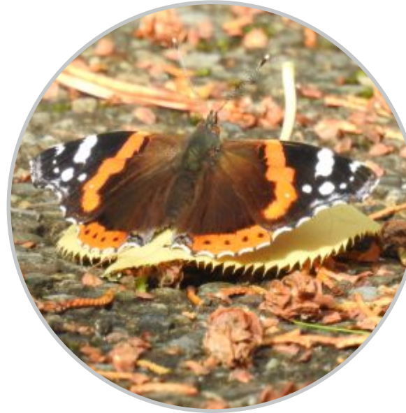
42 | Admiral im November